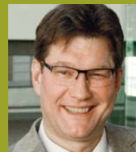
Uwe Heimowski Politikbeauftragter am Dt. Bundestag