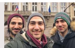
Band „Samras“ aus Aleppo, u. a. interkulturelle Musikgruppen