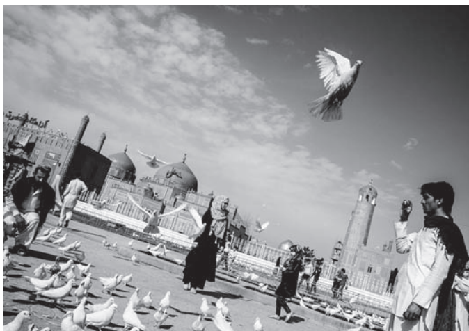
Die blaue Moschee in Masar-e Scharif, Mai 2014