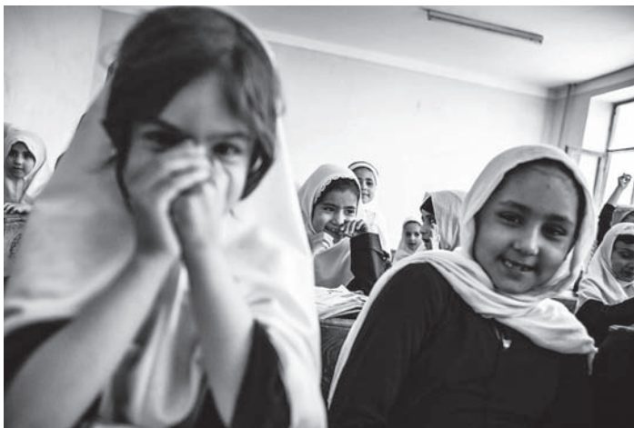
Eine Mädchenschule in Masar-e Scharif, Juni 2014