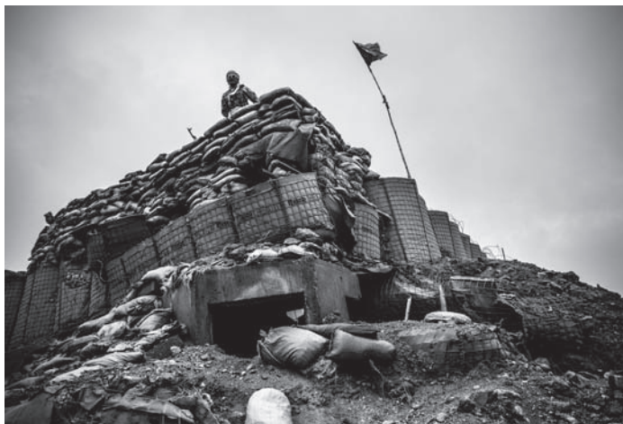
Kontrollposten der afghanischen Grenzpolizei in Abdul Khel, November 2017