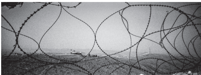
Blick vom Außenposten der Grenzpolizei Richtung Atschin