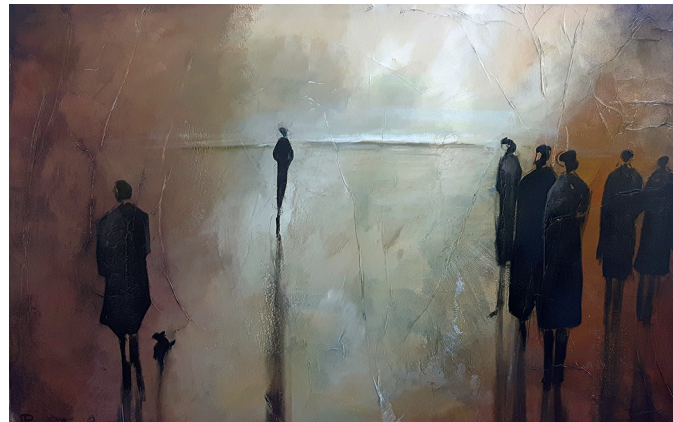
Patricia Hagner-Pitterle, „Aufbruch“

bis 25 Personen 40,00 Euro Jüdischer Friedhof 40,00 Euro Audioguide 2,00 Euro