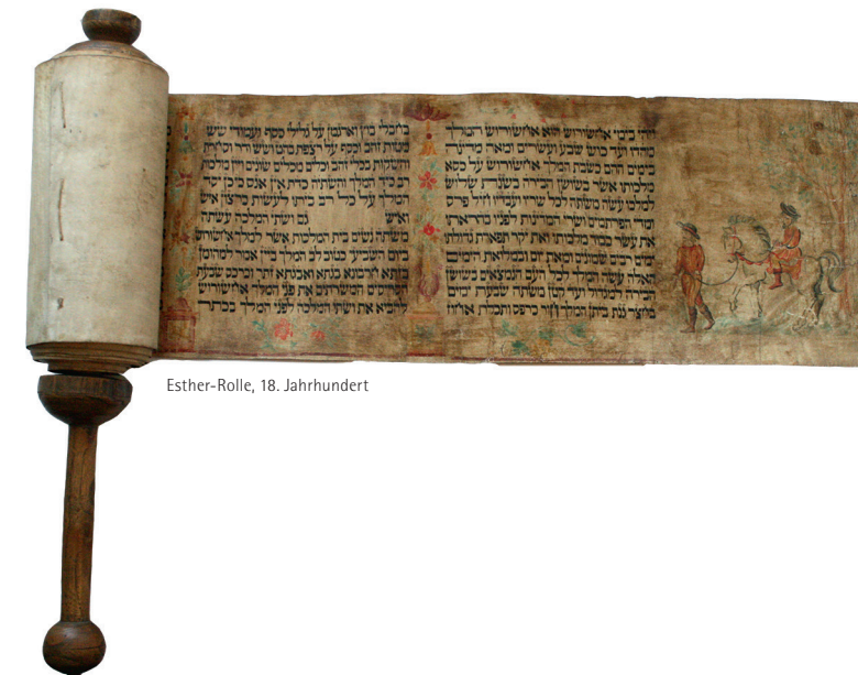
Esther-Rolle, 18. Jahrhundert

Die Stadtbibliothek Laupheim präsentiert im November 2018 Bücher zum Thema Menschenrechte.